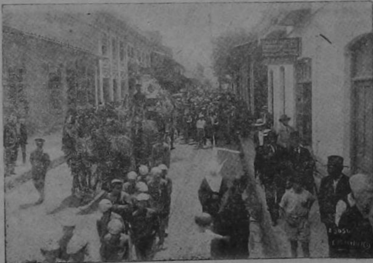
El cortejo fúnebre al dirigirse al Cementerio General.

Lentamente el cortejo desfilaron hacia el Cementerio General, mostrándose en todos los semblantes la huella de la tristeza que el fallecimiento