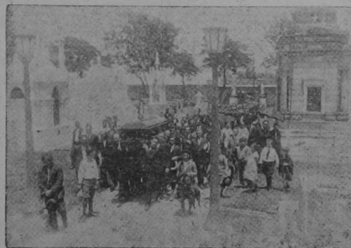
Entrada de la caja mortuoria al Cementerio General.