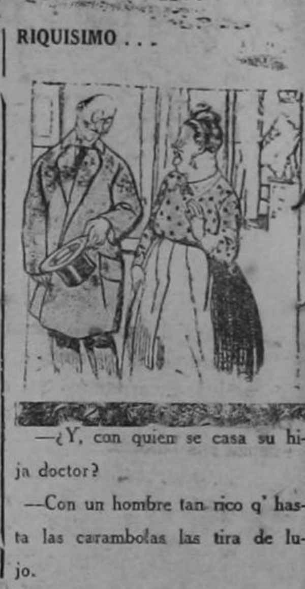
RIQUISIMO . . .

—¿Y su muchacho? —¡No me hable! Con eso del boxeo, le entró el furor de dar puñetazos, y se pegaba con todo el mundo. Lo he metido en una fábrica de engrudo!